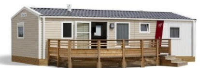
Mobilheim 6 plätze